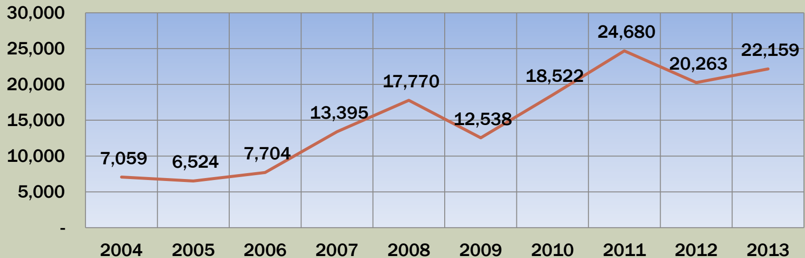
Realisasi harga rerata ekspor timah Indonesia (US$/MT)